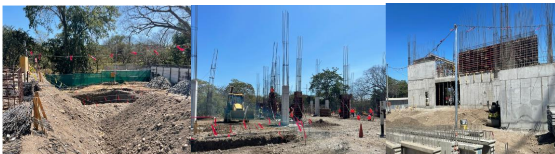
Ilustración 4 avance de construcción del Edificio Puntarenas

El proyecto presenta características de alto nivel, tales como certificación LEED en eficiencia energética y diseño sostenible, sistema de paneles solares, reutilización de aguas de lluvia, accesos ley 7600, normativa para garantizar la seguridad humana. Además, contará con salas de juicio según la materia, salas de capacitaciones, sala magna, comedor y gimnasio para el personal.