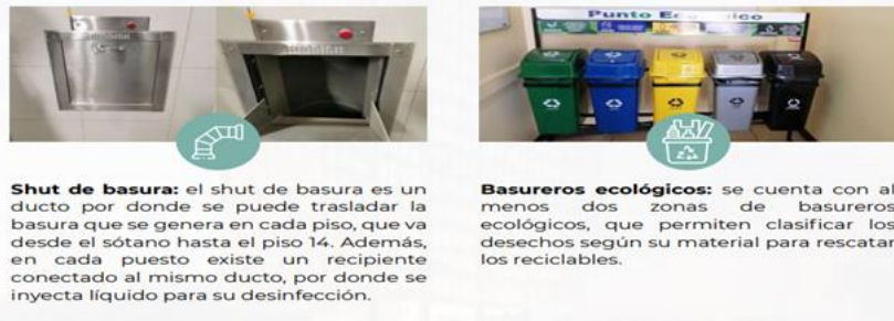
Ilustración 2 Edificio manejo de desechos

El edificio Torre Judicial cuenta con sistemas para asegurar la continuidad del servicio que brindan las oficinas: