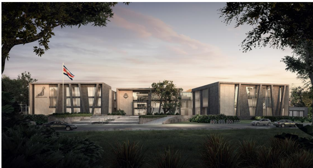
Ilustración 3 nuevo Edificio Puntarenas

El costo aproximado de las obras, según oferta con mejora de precios ronda los $39 millones de dólares, en un área de construcción de aproximadamente 23.000 m 2 y un área externa de 6.200 m 2 (parqueos, circulaciones, zonas verdes, etc.).